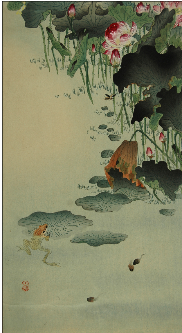
Tuntematon taiteilija (Japani). Puupiiirros ja akvarelli.